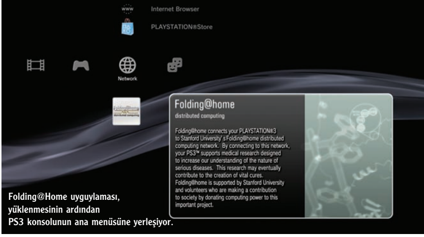
Folding@Home uygulaması, yüklenmesinin ardından PS3 konsolunun ana menüsüne yerleşiyor.

nellikle ekran koruyucu olarak yer alan ve bilgisayar belli bir süre boş kaldığında devreye giren uygulama, veriyi gerekli şekilde analiz ederek sonuçları ana bilgisayara geri gönderiyor. Ana bilgisayar da dünyanın dört bir yanından gelen parçaları birleştirerek bütünleşik sonucu ortaya koyuyor. Böylece binlerce, hatta milyonlarca işlemciyi ortak bir çözüm için bir araya getiren dağıtık bir süperbilgisayar ağı oluşuyor.